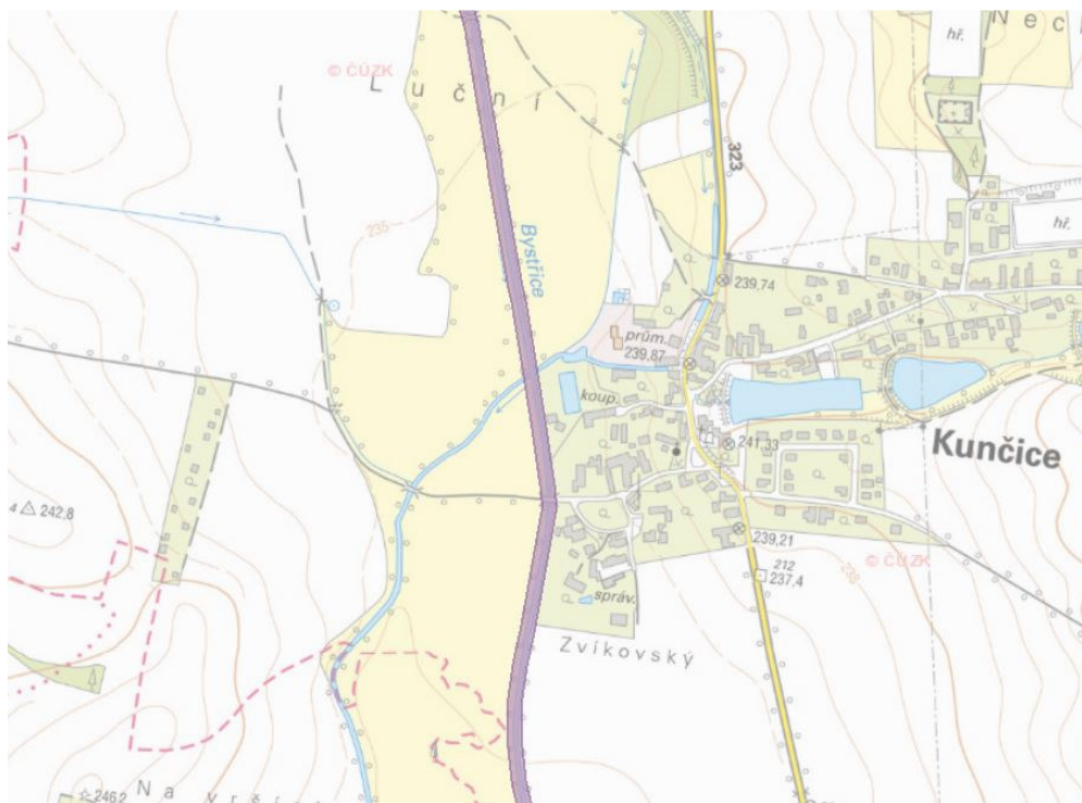
Zákres EVL Bystřice